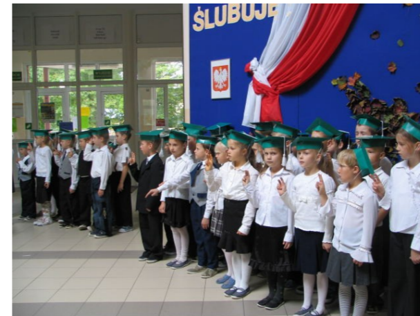
Do Samorządowego Zespołu Szkół dołącza szkoła podstawowa - Ślubowanie pierwszoklasistów

⌚ 15 X 2005 - 14 X 2006 r. Realizujemy projekt „Szkoła Marzeń” finansowany z funduszu EFS.