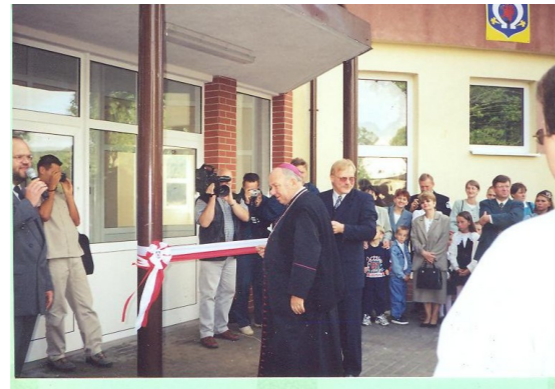
Uroczyste otwarcie szkoły

⌚ 15 IV 2000 r. - Po raz pierwszy uroczystie obchodziliśmy Dzień Ziemi, która to impreza dydaktyczno-wychowawcza weszła do tradycji naszej szkoły wraz z Turniejem Klas o Puchar Przechodni „Błękitna Planeta”.