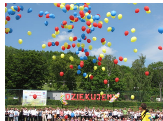
Otwarcie boiska „Orlik”