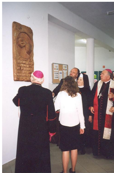
Nadanie imienia gimnazjum

⌚ 26-28 V 2000 r. - Spotkanie naszych uczniów wyróżniających się w nauce z uczniami Szkoły Polskiej im. Szymona Konarskiego w Wilnie podczas wycieczki sponsorowanej przez władze naszej gminy.