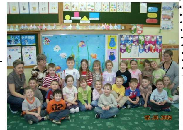
Do Samorządowego Zespołu Szkół dołącza przedszkole

⌚ 4 czerwca 2005 r. - Po raz pierwszy przy współpracy Rady Sołeckiej i Rady Rodziców organizujemy Festyn „Rodzina w Szkole”, który od tej pory będzie corocznie odbywał się na przełomie maja i czerwca.