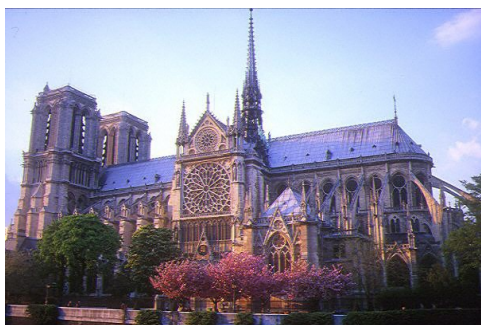
Paryż- Katedra Notre Dame

ry, długie ulice pełne eleganckich sklepów z