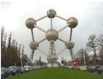
Bruksela – Atomium

nak jedyny niemiły akcent pobytu w Brukseli. Byliśmy na głównym placu miasta, gdzie strzelisty gotyk miesza się w niezwykle sposób z przysadzistym barokiem. Oglądaliśmy również słynną brukselską fontannę przedstawiającą siusiąjącego chłopca i wjechaliśmy na szczyt Atomium, niezwyklego pomnika powiększonego modelu atomu żelaza. Widok, jaki roztaczał się z góry, był niesamowity.