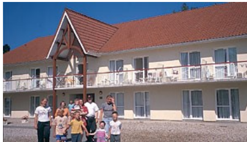
ośrodek Stella Maris

Zatrzymaliśmy się w ośrodku Stella-Maris, w niewielkim miasteczku Stella-Plage. Smaczne posiłki, mili ludzie - sielski obraz prowincjonalności. Wycieczkę do Pa-