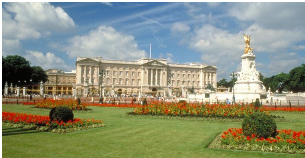
Londyn- Buckingham Palace

dyn. „Królowa czeka na was z otwartymi ramionami” zapewniała roześmiana od ucha do ucha pani przewodnik „Podejźmy pod Buckingham Palace, potem pod mieszkanie Karola i Kamili. Na pewno ją zobaczycie”. Co prawda wbrew zapewnieniom pani przewodnik nie powitała nas rodzina królewska, ale przecież nie tylko z tego miasto słynie. To także stolica nauki. Londyn jest siedzibą Towarzystwa Królewskiego, Uniwersytetu Londyńskiego, Polskiego Uniwersytetu na Obczyźnie oraz wielu innych szkół wyższych. Jest także dużym ośrodkiem kulturalnym: opera Covent Garden, słynne orkiestry między innymi London Symphony Orchestra, BBC Orchestra i London Philharmonic Orchestra oraz teatry. Znajdują się tu liczne muzea i galerie, które przyciągają turystów z całego świata. Najbardziej znane to British Museum, National Gallery, Tate Gallery, London Museum i Science Museum. Mogliśmy podziwiać też piękne i zadbane parki np. Hyde Park, St. James Park, Kew Gardens, Green Park, Regent's Park, na trawnikach których można zgodnie z prawem urządzić sobie popołudniową sjęstę. Londyn słynie również z dwupiętrowych czerwonych autobusów, czerwonych budek telefonicznych i staromodnych czarnych taksówek, w których siedzenia dla pasażerów ustawione są naprzeciwko siebie.